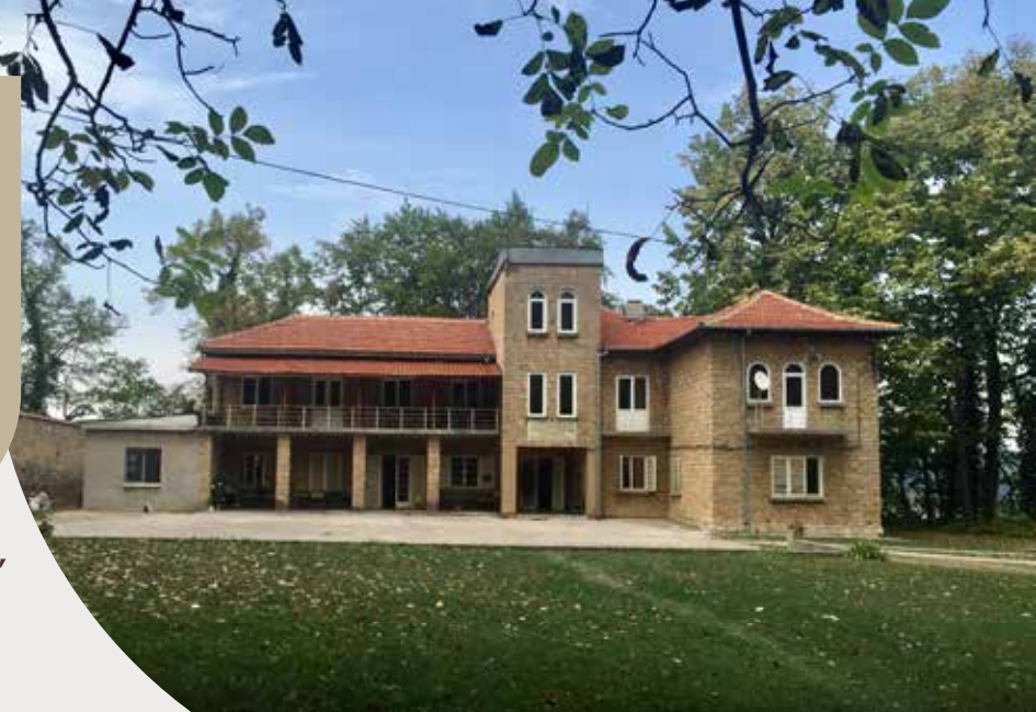
Соколски манастир "Успение Богородично"

Почивни бази в близост до популярни религиозни храмове и светилища в България